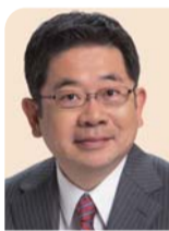
比例代表 小池 晃