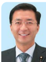
比例代表 山下 芳生