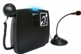
ループピアで打ち合わせもスムーズに進められそうです

必要性はない。ループピアは各課の必要性を見て設置を進めたい。福祉課に言語聴覚士の資格者はいないのでネットワークを作って難聴者の支援体制は取れない。